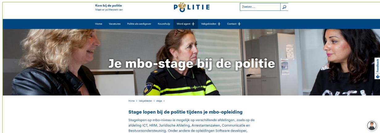
Figuur 9. Schermkopie van de website Kombijdepolitie.nl (29-04-2024)

stageplekken is voor de ROC's leidend voor de toelating. Als er onvoldoende stageplekken zijn laten de ROC's noodgedwongen minder studenten toe (numerus fixus).