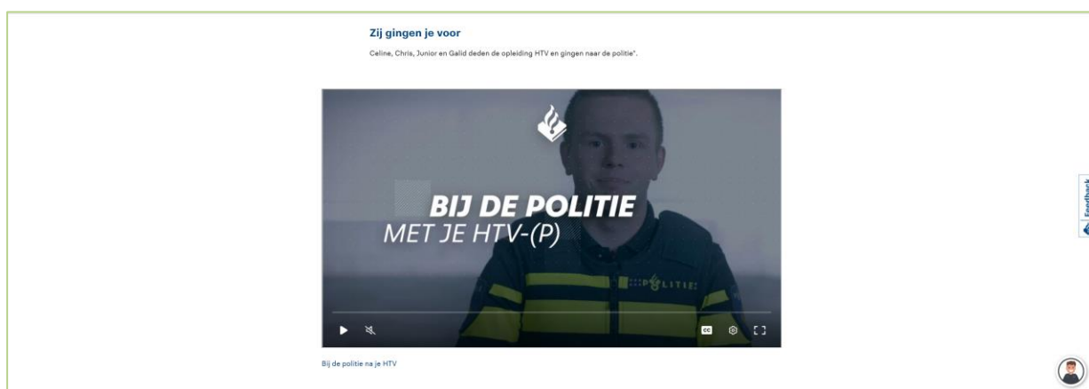
Figuur 1. Schermkopie van de website Kombijdepolitie.nl (29-04-2024)

In 2021 is de nieuwe basispolitieopleiding niveau 4 van start gegaan waardoor het doorstroomprogramma niet gecontinueerd kon worden en er nieuwe afspraken gemaakt moesten worden over de aansluiting en samenwerking tussen het mbo-veld, Politie en Politieacademie.